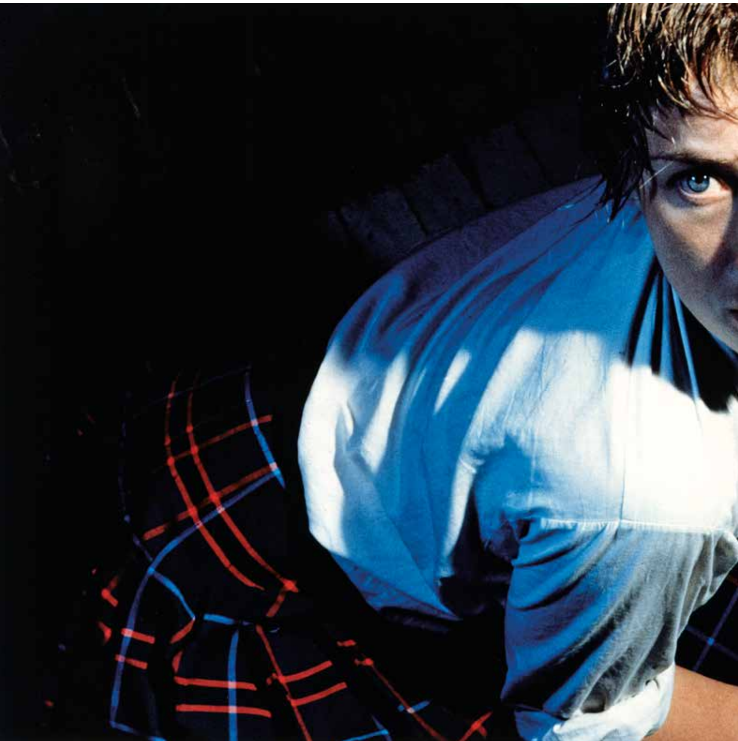
Cindy Sherman , Untitled 92 , 1981, fotografia, Minneapolis, Walker Art Center, courtesy the artist and the Walker Art Center, Minneapolis, opera esposta alla mostra American Art 1961-2001 , Firenze, Palazzo Strozzi [25 maggio - 2 agosto 2021]