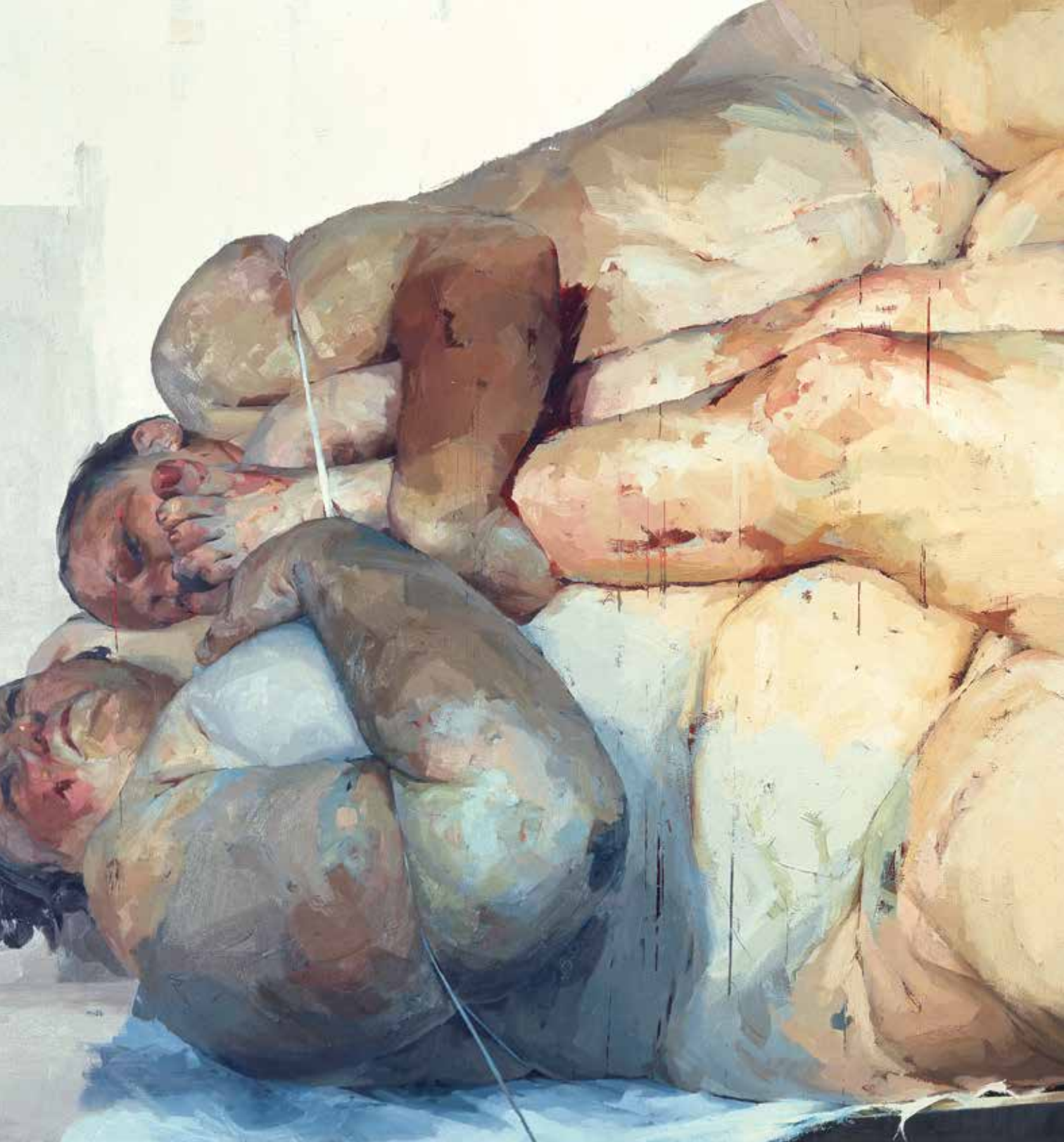
Jenny Saville , Fulcrum , 1999, olio su tela, cm 261,6x487,7, collezione privata, © Jenny Saville. Tutti i diritti riservati, DACS 2021 opera esposta alla mostra Jenny Saville , Firenze, Museo Novecento, Museo di Palazzo Vecchio, Museo dell'Opera del Duomo, Museo degli Innocenti e Museo di Casa Buonarroti [30 settembre 2021 – 20 febbraio 2022]