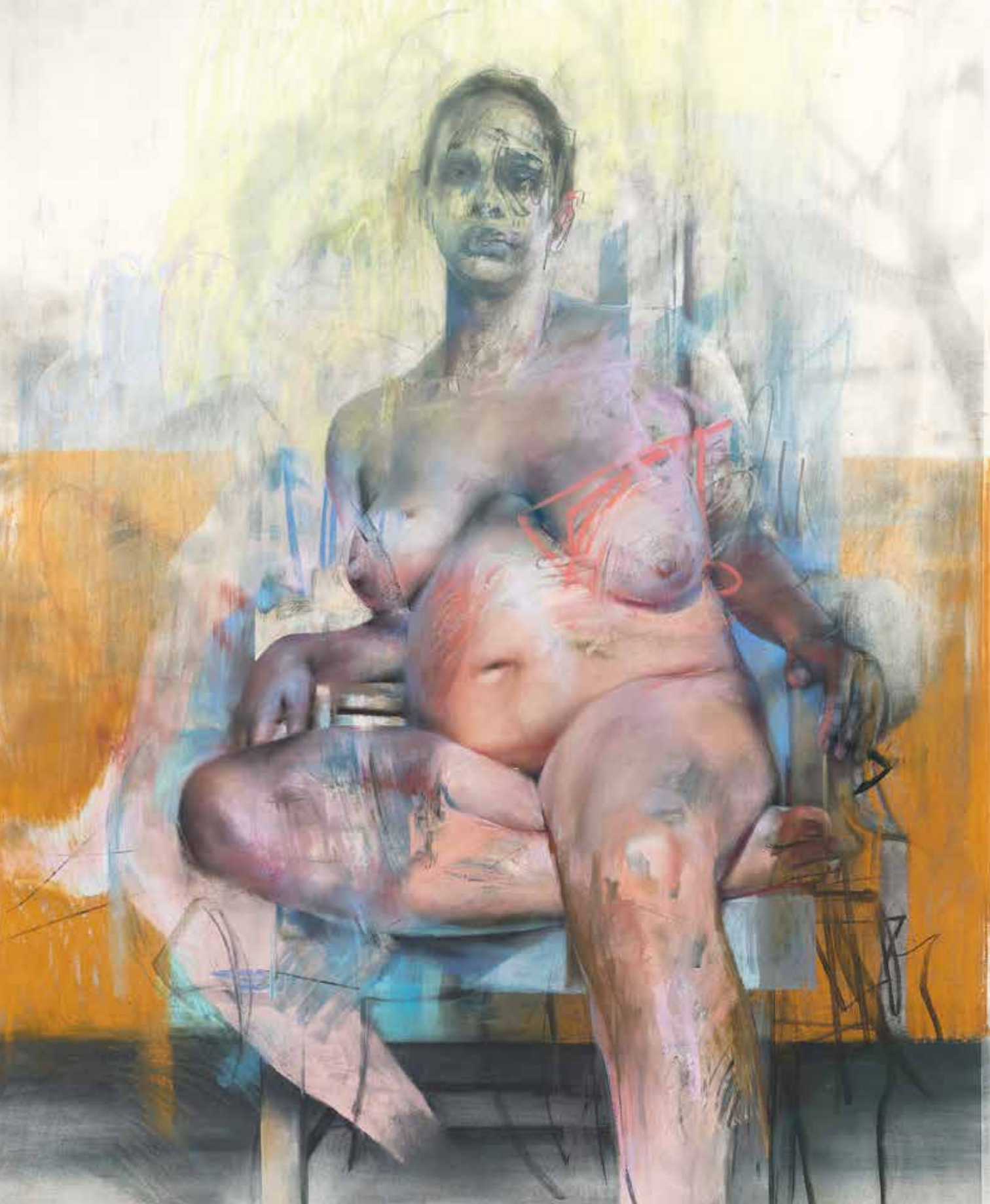
Jenny Saville, Gestation, 2017, pastello e carboncino su carta montata su cartone telato, cm 200x152, Parigi, collezione privata, opera esposta alla mostra Jenny Saville, Firenze, Museo Novecento, Museo di Palazzo Vecchio, Museo dell'Opera del Duomo, Museo degli Innocenti e Museo di Casa Buonarroti [30 settembre 2021 - 20 febbraio 2022]