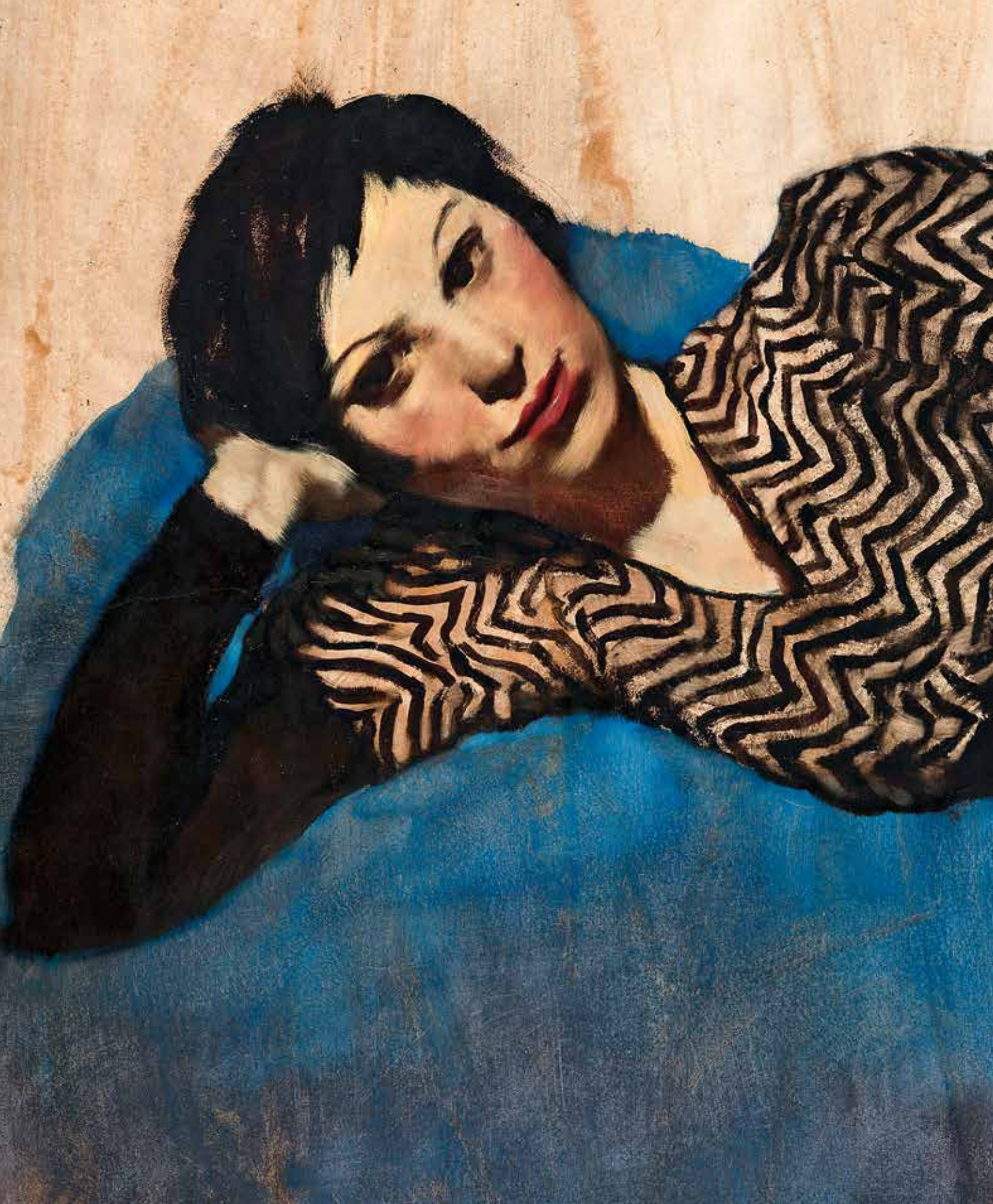
Lotte Laserstein , Liegendes Mädchen auf Blau , 1931 circa, olio su carta, cm 69x93, Germania, collezione privata, opera esposta alla mostra Close-up , Riehen/Basel, Fondation Beyeler [19 settembre 2021 - 2 gennaio 2022]